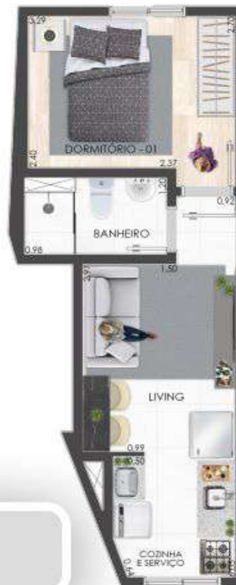
UNIDADES 11 E 21 27,98 M 2 PAVIMENTOS 1 E 2