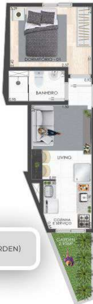
UNIDADE 01 27,98 M 2 + 2,95 M 2 (GARDEN) PAVIMENTO TÉRREO